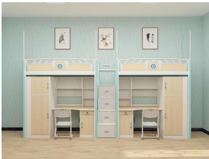
(研究生公寓套装家具(加长型/标准型)参考例图)

说明：①本技术要求表中描述涉及品牌（如有）均为参考，投标人可提供同等档次或更高档次产品，并提供相应技术参数证明其符合采购需求。无标识则表示属一般指标项。本项目响应文件必须提供《技术响应偏离表》并将具体响应值填写清楚，未按要求填写《技术响应偏离表》或响应值直接复制招标文件参数的，视为技术参数偏离。